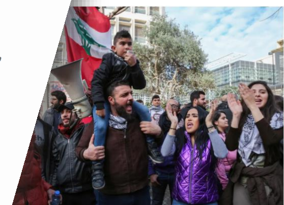
Proteste in Libanon gären schon länger. (Beirut, 1.2.2020)

Mittwoch haben sich vor der Schweizer Botschaft in Beirut mehrere hundert Personen zu einer Kundgebung versammelt. Sie forderten die sofortige Einfrierung und raschestmögliche Rückgabe der von Politikern und hohen Beamten mutmasslich illegal angehäuften Vermögen, die auf Schweizer Konten liegen sollen.